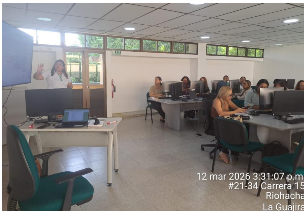
Ilustración 6. Reunión para revisión y apropiación de lineamientos estratégicos del programa Campe-SENA