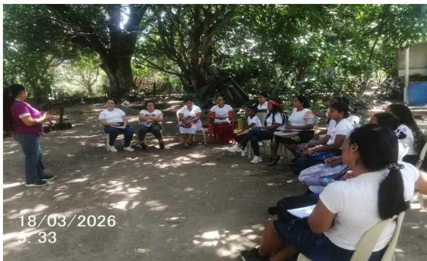
Ilustración 3. Tiquetes ida y regreso Riohacha –Santa Rita de Jerez- Riohacha