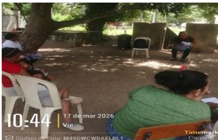
Ilustración 2. Tiquetes ida y regreso Riohacha –Santa Rita de Jerez- Riohacha