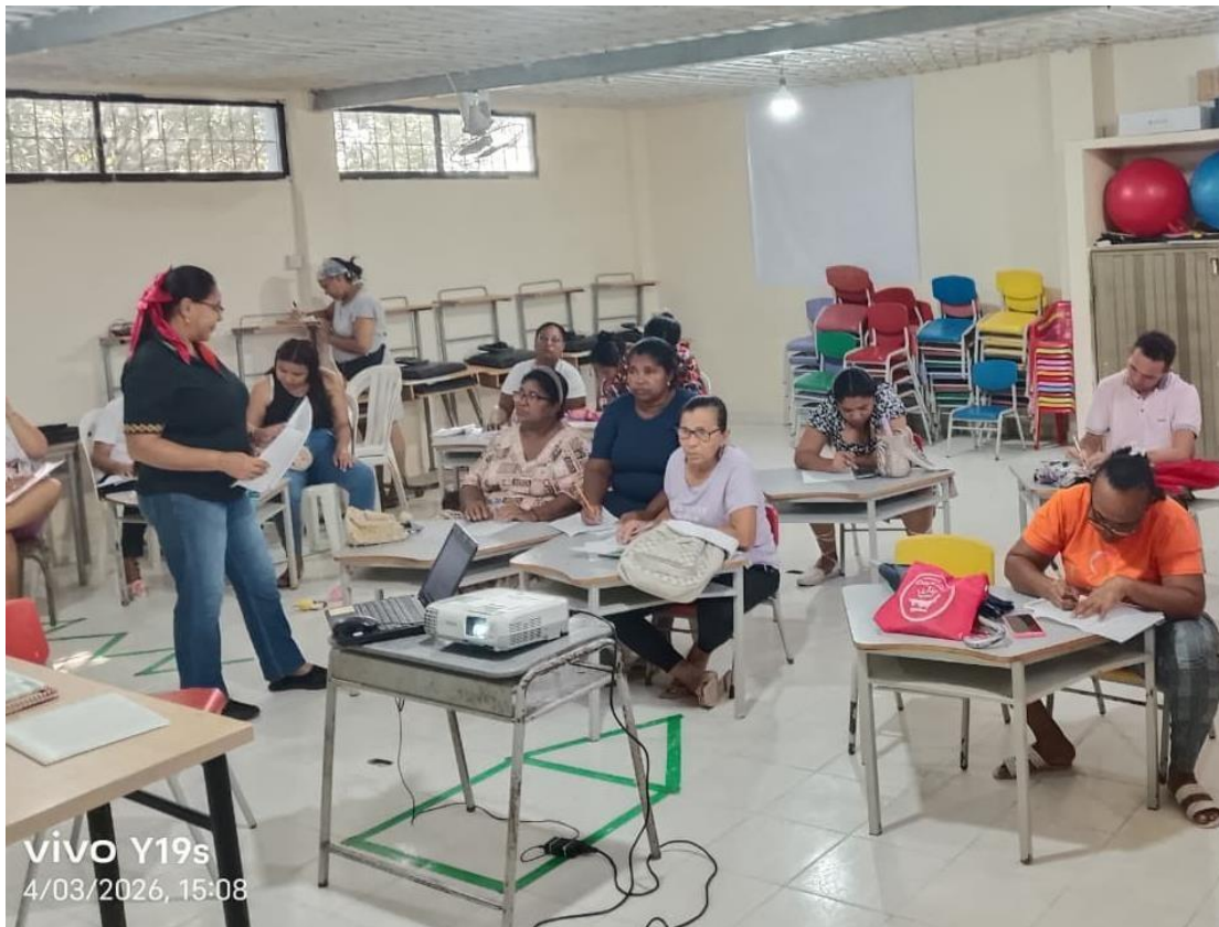
Ilustración 4. Formación complementaria

Gestión: Se imparte formación complementaria del programa Emprendimiento Innovador código 11220053.