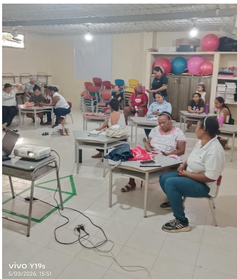
Ilustración 3. Diálogo participativo con miembros de la comunidad

Gestión: Diálogo participativo con miembros de la comunidad sobre necesidades productivas familiares, identificación de oportunidades de fortalecimiento de economía popular y sensibilización frente a la importancia de la formación para mejorar capacidades productivas.