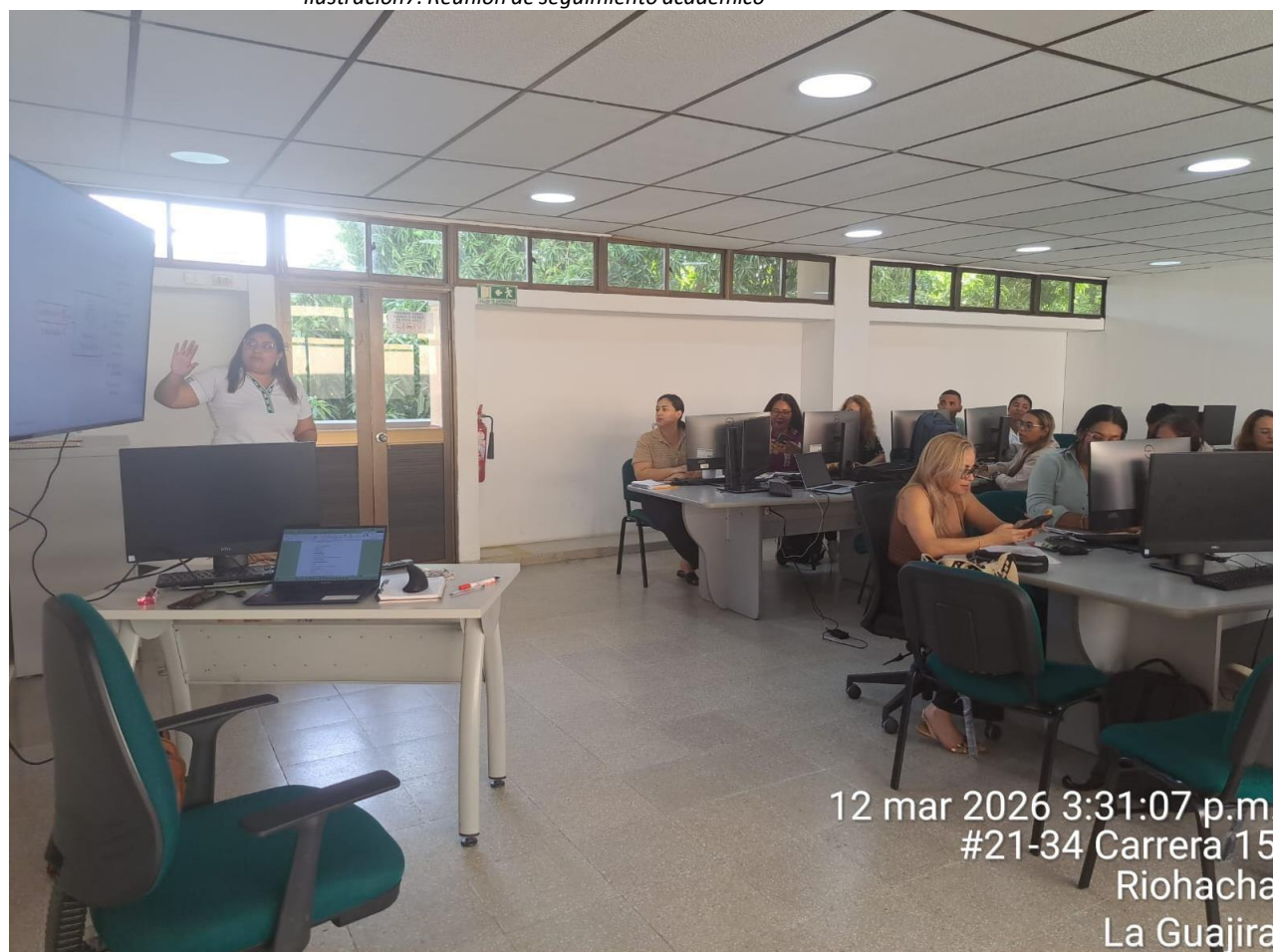
Ilustración 7. Reunión de seguimiento académico